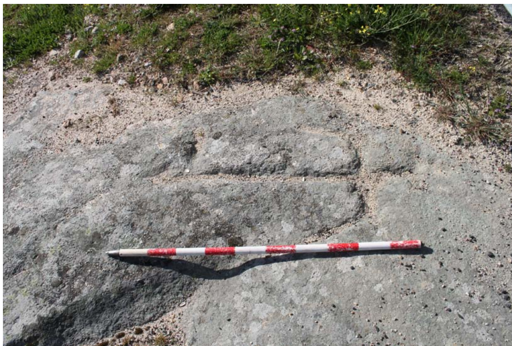
Imagen 12. Grabado rupestre presente en la UA.

El yacimiento Camino de los Dulces (37-373-0001-10) se localiza al norte del casco urbano, muy cerca del mismo, junto a la carretera que une Villavieja con Yecla de Yeltes. Se trata de un grabado rupestre realizado en un afloramiento granítico situado junto a la carretera. Se constató la presencia del mismo, sin poder aportar más información que la presente en la ficha del inventario. Se le ha asignado la UA 10 , prospectando su entorno hasta un total de 0,12 Ha.