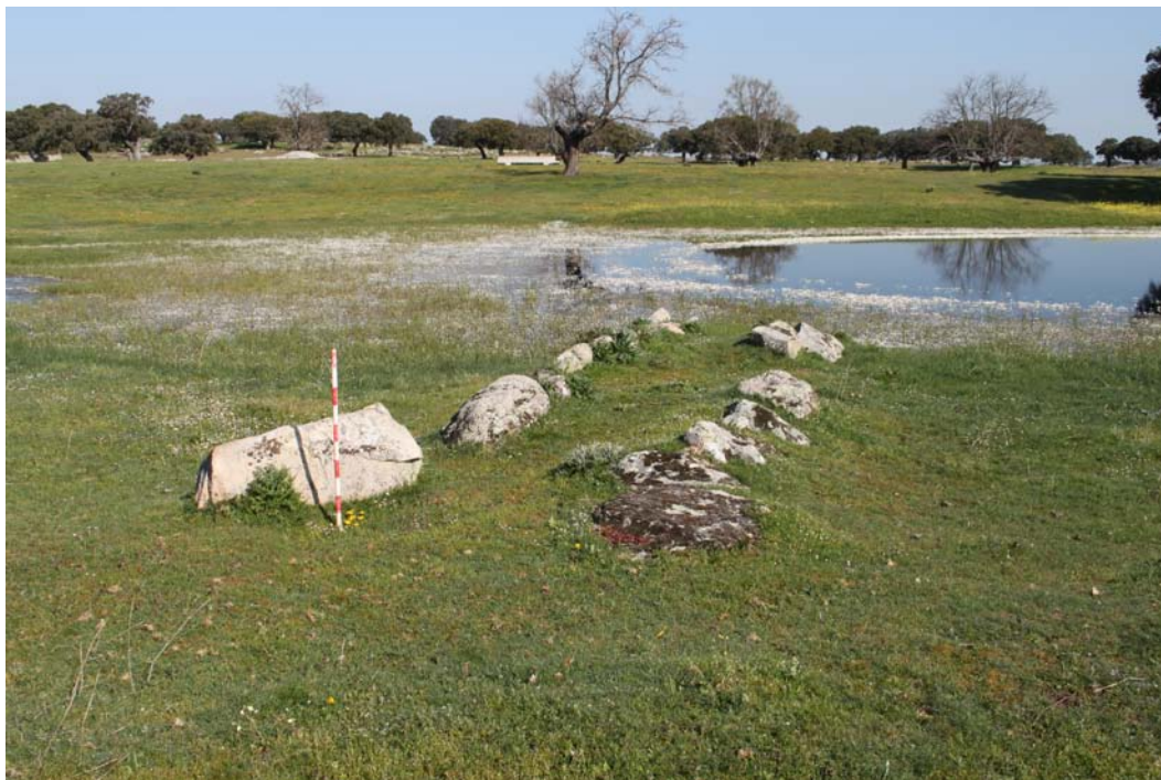
Imagen 3. UA 1. Detalle de los restos arqueológicos.

terreno, dedicado a pastos, tenía una buena visibilidad. Durante la prospección, en la que se recorrieron las 0,03 Ha correspondientes al yacimiento junto con el entorno inmediato, se pudo constatar la existencia de los restos materiales mencionados en las fichas del inventario, sin poder aportar nueva información al mismo.