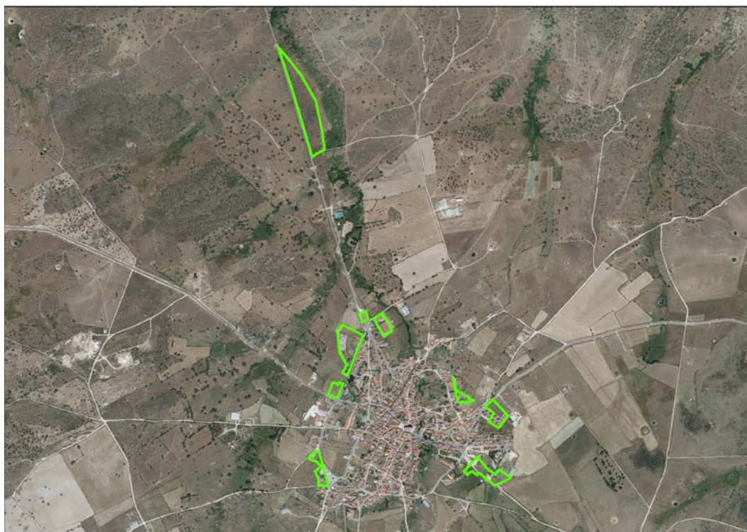
Imagen 1. UA 12 (en verde).

La superficie afectada por la futura clasificación/calificación se encuentran en el entorno más inmediato del casco urbano de Villavieja de Yeltes, con un total de 32 hectáreas a reclasificar. Apenas encontramos superficie susceptible de ser prospectada, 5 Ha aproximadamente ya que en su mayoría se trata de terrenos ya edificados. El total del área de prospección está representada en distintas superficies que hemos identificado en la Unidad de Actuación 12 (Ver Anexo 3, nº 3).