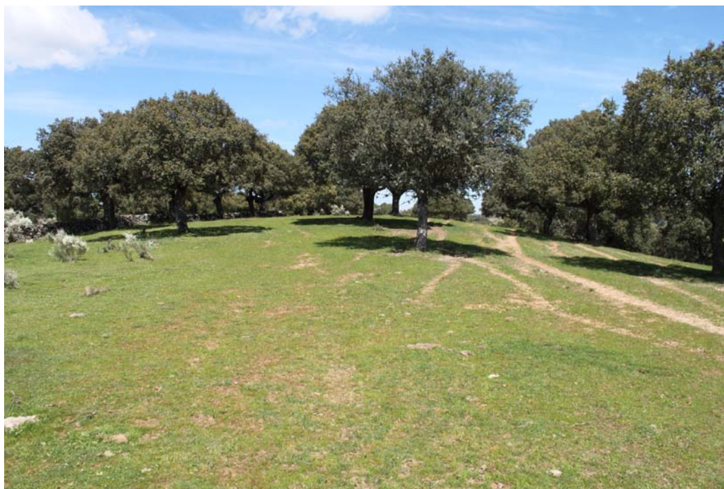
Imagen 6. Visibilidad del terreno en la Unidad de actuación.

La Pernalona (37-373-0001-04) se localiza al Este del término municipal, en una loma que domina en su margen izquierda un meandro del río Yeltes. Se prospectaron las 0,15 Ha y su entorno inmediato, llegando así a las 0,8 Ha que cubre la UA 4 . La visibilidad del terreno, ocupado por pastos, era buena. A pesar de ello, no se pudo constatar la presencia de ningún material arqueológico, por lo que se da por buena la información existente a día de hoy en la ficha del inventario.