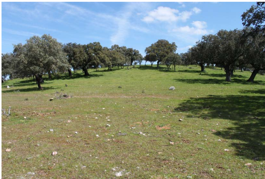
Imagen 9. Fotografía general de la unidad de actuación.

margen izquierda del río. La presencia de pasto alto y matorral permitió una peritación visual regular del terreno. No se hallaron restos materiales en la superficie que permitan aportar nueva información a la existente en la ficha del inventario. Se prospectó una superficie total de 0,9 Ha, englobando así toda la cima del cerro en la que se encuentra el yacimiento.