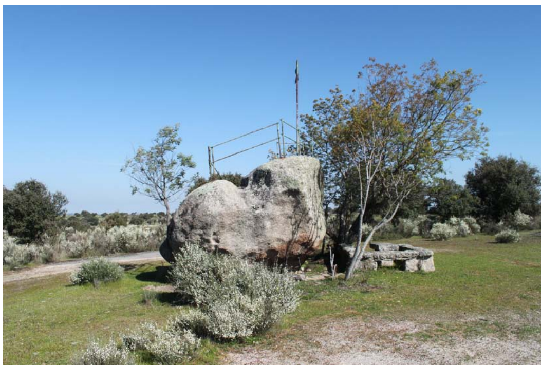
Imagen 13. Detalle de la peña grabada presenta en la UA.