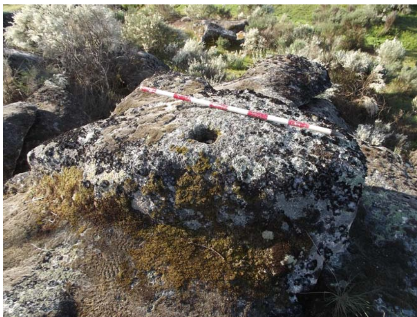
Imagen 10. Detalle de una de las piedras de molino sin extraer.

La UA 9 ha sido asignada al yacimiento del Rodillo de las Huertas (37-373-0001-09), que se localiza al Noreste del casco urbano, aproximadamente a 1.500 m del mismo. El terreno, ocupado por pastos, permitía una muy buena visibilidad del sustrato. Se constató la presencia de los restos descritos en la ficha del inventario, sin poder aportar nuevos hallazgos. En este caso, se ha corregido la localización del yacimiento, ya que en la prospección se ha comprobado que la ubicación dada en la ficha del inventario no es correcta. El yacimiento se encuentra en la parcela más al oeste, en las siguientes coordenadas: X 715013/ Y 4528843 en proyección UTM ETRS89 y huso 29.