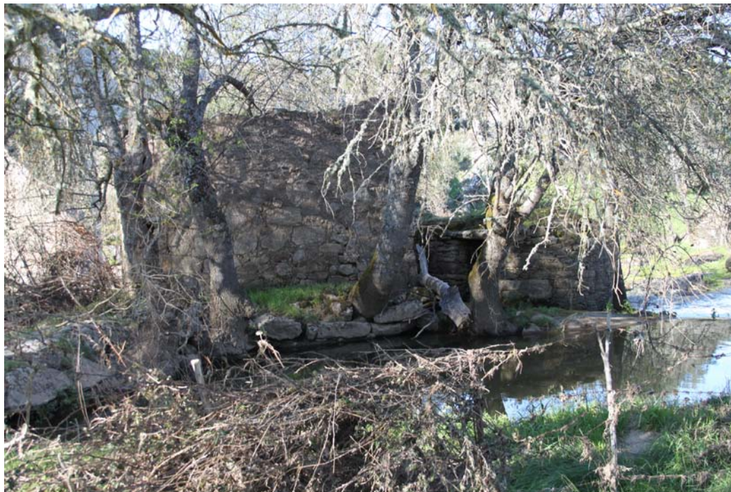
Imagen 14. Molinos del Puente.

El primero de los molinos prospectados es el molino del puente . Se localiza en el extremo norte del término municipal, junto al puente de la carretera que cruza el río. Realmente se trata de dos molinos contiguos contruidos para que el agua primero mueva una de las muelas y después la otra. Ambos tienen planta circular, contruidos con sillares irregulares de granito y con falsa bóveda. El estado de conservación de los mismos es malo.