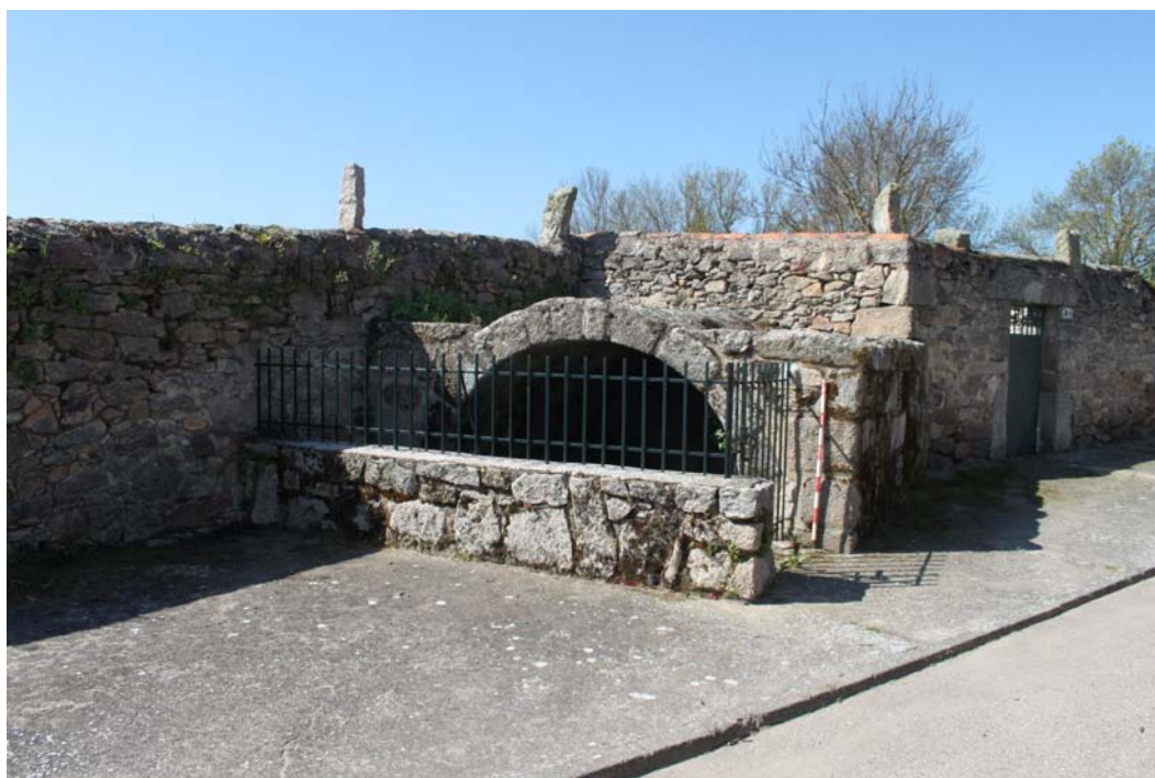
Imagen 5. Unidad de actuación 3.

El siguiente yacimiento prospectado fue Pozo de Arriba (37-373-0001-03), al que se le adjudicó la UA 3 . Se trata de una fuente ubicada en el casco urbano de Villavieja. Se constató en la prospección que la información existente en la ficha del inventario es correcta, sin poder aportar nueva información a la misma.