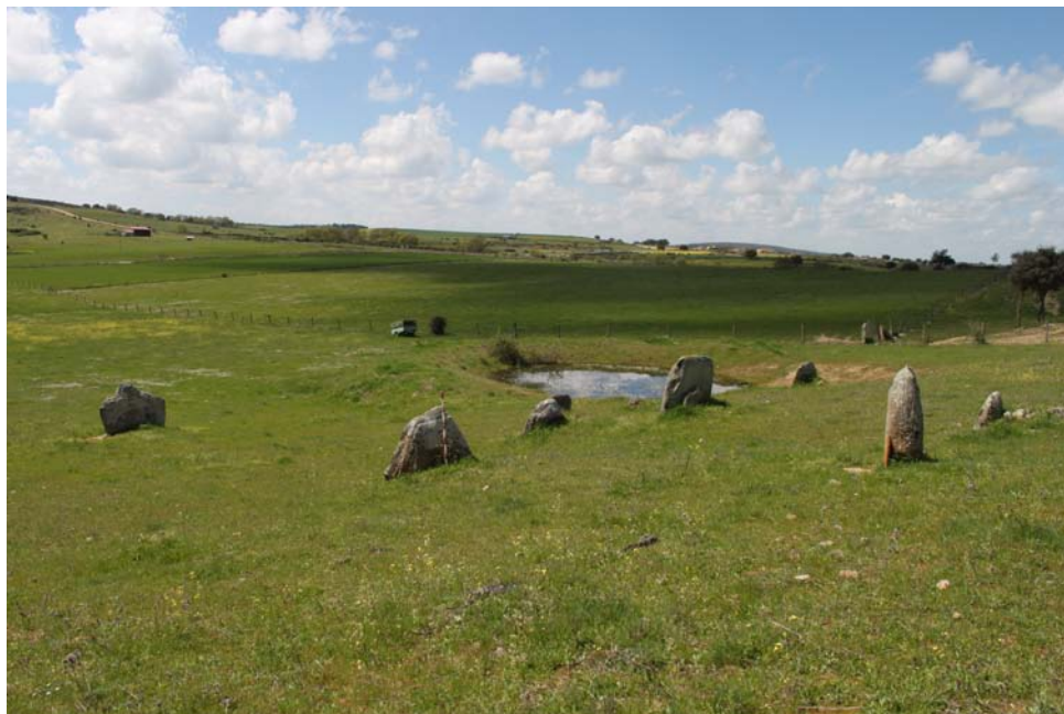
Imagen 11. Vista general del yacimiento ubicado en la UA.

La UA 9 ha sido asignada al yacimiento del Rodillo de las Huertas (37-373-0001-09), que se localiza al Noreste del casco urbano, aproximadamente a 1.500 m del mismo. El terreno, ocupado por pastos, permitía una muy buena visibilidad del sustrato. Se constató la presencia de los restos descritos en la ficha del inventario, sin poder aportar nuevos hallazgos. En este caso, se ha corregido la localización del yacimiento, ya que en la prospección se ha comprobado que la ubicación dada en la ficha del inventario no es correcta. El yacimiento se encuentra en la parcela más al oeste, en las siguientes coordenadas: X 715013/ Y 4528843 en proyección UTM ETRS89 y huso 29.