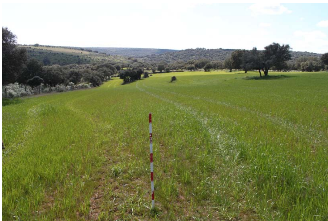
Imagen 4. Zona occidental de la UA, con mejor visibilidad.

El siguiente yacimiento prospectado fue Pozo de Arriba (37-373-0001-03), al que se le adjudicó la UA 3 . Se trata de una fuente ubicada en el casco urbano de Villavieja. Se constató en la prospección que la información existente en la ficha del inventario es correcta, sin poder aportar nueva información a la misma.