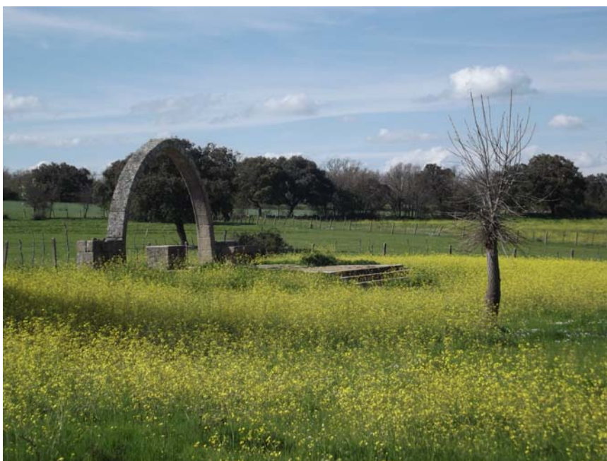
Imagen 7. Detalle de los restos de la ermita.

El yacimiento de La Mesa (37-373-0001-06), al que se le ha asignado la UA 6 se localiza muy cerca de La Pernalona, más al norte del mismo. Ocupa también un cerro destacado que controla un meandro del río Yeltes en su margen izquierda. La visibilidad del terreno, ocupada por pastos, era buena, lo que permitió la correcta peritación visual del lugar. Se prospectaron un total de 2,6 Ha, ampliando de este modo las 1,91 Ha que ocupa el área asignada al yacimiento en el inventario. Se encontró en esta prospección un galbo cerámico con carena hecho a mano que puede corresponderse perfectamente con la cronología asignada al yacimiento. Este fragmento se encontró fuera del área asignada al yacimiento en el inventario, por lo que podría plantearse ampliar su extensión a la indicada en el presente proyecto.