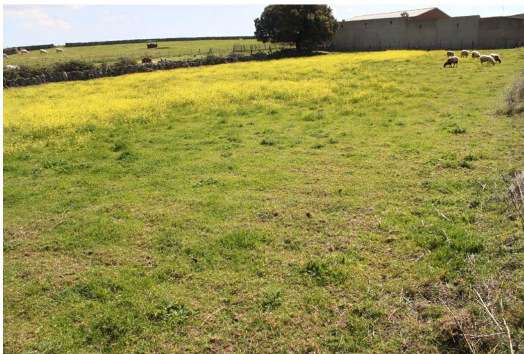
Imagen 2. Detalle de una de las parcelas sin edificar con visibilidad regular.