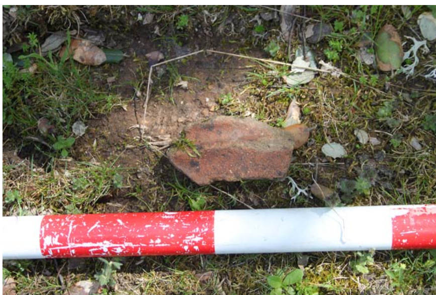
Imagen 8. Fragmento cerámico hallado en la unidad de actuación.

El yacimiento de La Mesa (37-373-0001-06), al que se le ha asignado la UA 6 se localiza muy cerca de La Pernalona, más al norte del mismo. Ocupa también un cerro destacado que controla un meandro del río Yeltes en su margen izquierda. La visibilidad del terreno, ocupada por pastos, era buena, lo que permitió la correcta peritación visual del lugar. Se prospectaron un total de 2,6 Ha, ampliando de este modo las 1,91 Ha que ocupa el área asignada al yacimiento en el inventario. Se encontró en esta prospección un galbo cerámico con carena hecho a mano que puede corresponderse perfectamente con la cronología asignada al yacimiento. Este fragmento se encontró fuera del área asignada al yacimiento en el inventario, por lo que podría plantearse ampliar su extensión a la indicada en el presente proyecto.